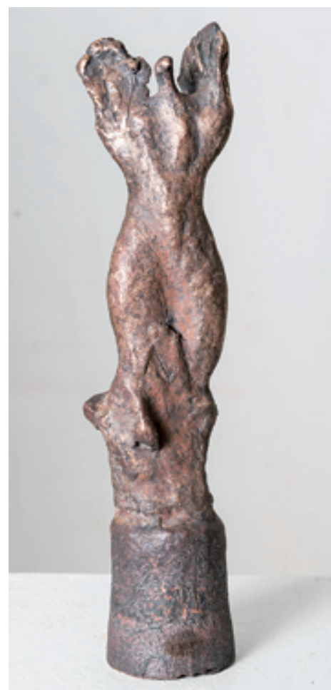
Renate Ott; Phönix aus der Asche ; 2018, 30 cm x 7 cm x 5 cm (H x B x T), Bronze © Renate Ott; Foto: Donald Unter Ecker

sondern sich dynamisch in den verschiedenen Entstehungsphasen eines Werkes zur Entfaltung bringt. Diese innere Wahrheit eines Kunstwerkes macht seine Authentizität aus. Gepaart mit der authentischen und ehrlichen Einstellung des Künstlers gegenüber seinem Schaffen, egal ob naturrealistisch oder abstrakt in der Darstellungsform, zieht jedes Kunstwerk den Betrachter in seinen Bann - im positiven wie im negativen Sinn“, erklärt Renate Ott.