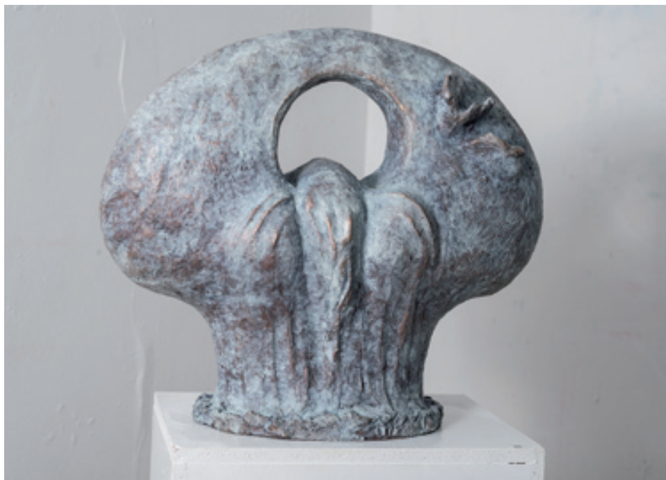
Renate Ott; Gegenwart - Immerwährender Kreislauf ; 2017, 45 cm x 55 cm x 25 cm (H x B x T), Bronze patiniert © Renate Ott; Foto: Donald Unter Ecker

Nachdenken und zur Stellungnahme, im positiven wie im negativen Sinn, herausfordert“, soweit dazu Renate Ott.